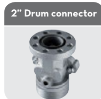
with integrated valve Code FI7163000