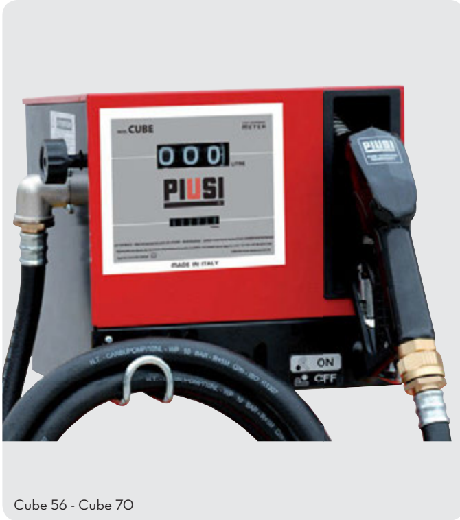
Cube 56 - Cube 70