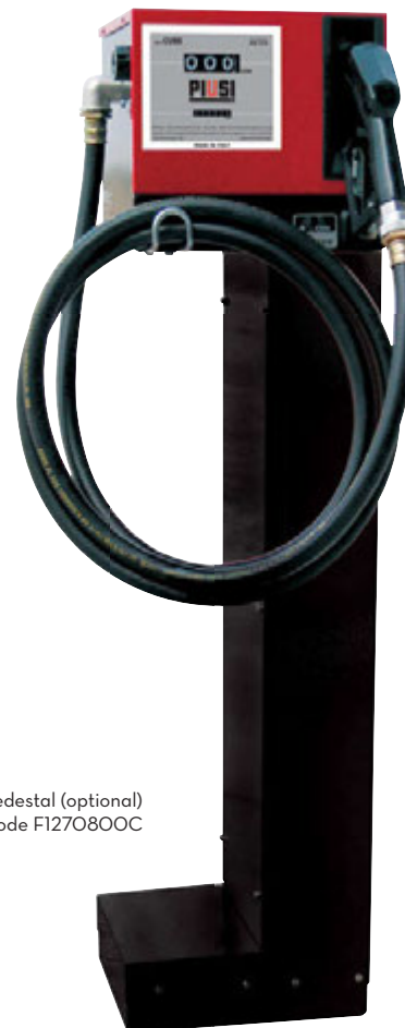
Pedestal (optional) Code F1270800C